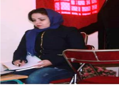
مقررة الدورة الأستاذة إيجو أحوضيك م م تزغت